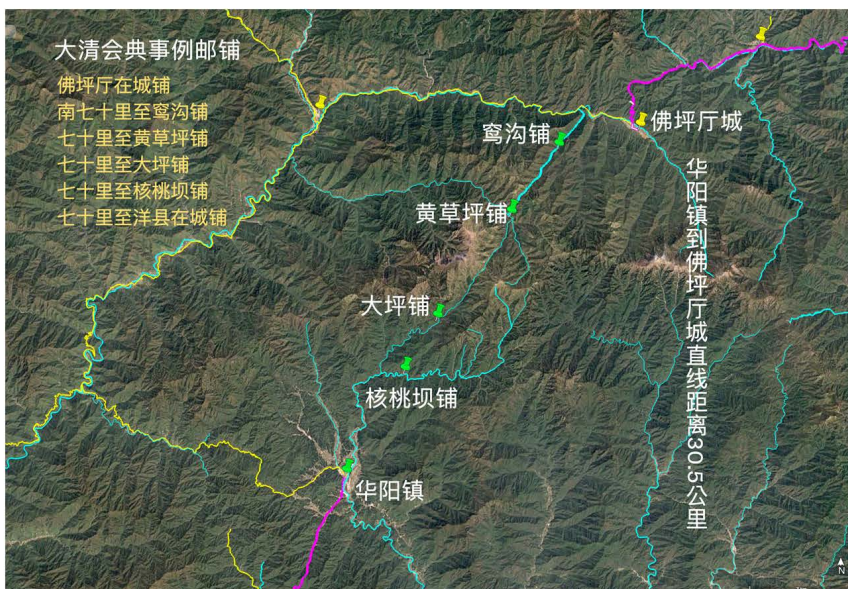
图4 清代佛坪厅邮铺

3. 《大清会典事例》所载佛坪县邮铺太匪夷所思,以图形说明之。如〈图4〉所见,佛坪厅有五个铺,每个都距离七十里,合计邮路即有350里,但从佛坪厅城到华阳镇,直线距离只有30.5公里,沿溪谷与山路计算的话,约有46.365公里,其记载明显有误。而且,这五个铺