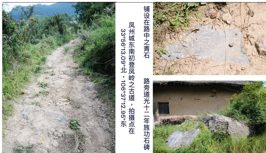
图2 连云栈入口有古代驿路的铺石形式,道旁有碑,可证为道路。

门海拔 1783 米, 33^{\circ}54'0.08'' 北, 106^{\circ}38'4.10'' 东; 下峡至心红峡(新红峡)心红铺, 海拔 1423 米。最后到三岔驿, 海拔 1152 米。从凤州城到三岔驿是艰难的越岭道路, 全程就是上下凤岭的过程。此路即连云栈的北口,《析津志》曾经提到这个名称,《明祖实录》多次记载了“连云栈”, 此后一直被流传于明清记载中。笔者曾到古道中考察, 在 33^{\circ}56'13.09'' 北, 106^{\circ}37'12.95'' 东, 看到路上有大量作为路基的大石, 路旁屋前还有一块道光十二年的旌功碑, 上书“敕授昭武都尉甘肃白塔营都司鼎南”, 白塔营都司属西宁军, 应是凤县人出任白塔营都司也。 ①