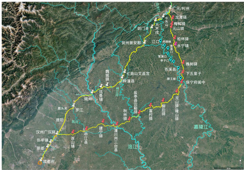
图3 大散关道全路程上——利州至成都

广元县以后，主路线不由剑门关，而是采取陆路到阆州、梓州，然后西入成都，与唐玄宗所行的道路不同。唐玄宗所行的道路，被以《朝天驿西北分剑阁路》为标题分割出来，成为第二道路，但是，1696年王士禛《秦蜀驿程记》往返都由此路，1810年陶澍《蜀輶日记》、1824年杨钟秀《万里云程》、1874年吴焘《游蜀日记》也都选择此路；《万里云程》甚至作了详细的分程记录。